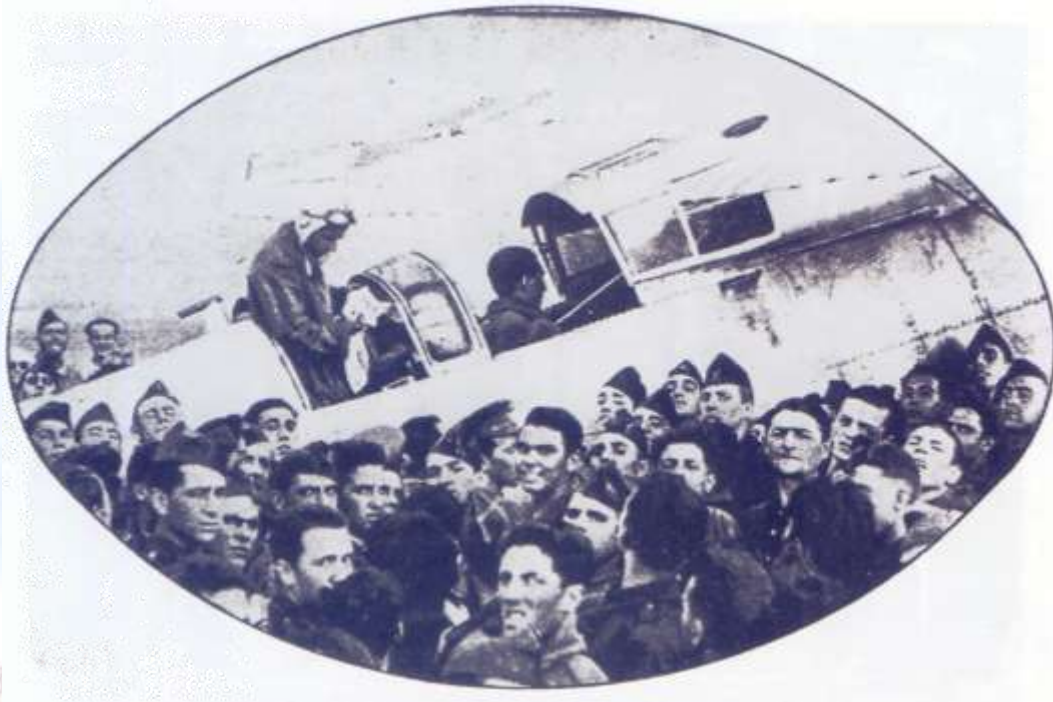
Ilustración 7. La llegada de los aviadores al aeródromo de Tablada, en donde les esperaba una comisión del Aero Club de Andalucía, junto con sus compañeros.

Despegaron igualmente del aeródromo de Tablada, a las 6 horas, 58 minutos y 22 segundos. Llevaban en los depósitos de combustible un total de 1.500 litros, 140 de aceite y 500 litros de agua, no utilizable, que representaba la carga comercial.