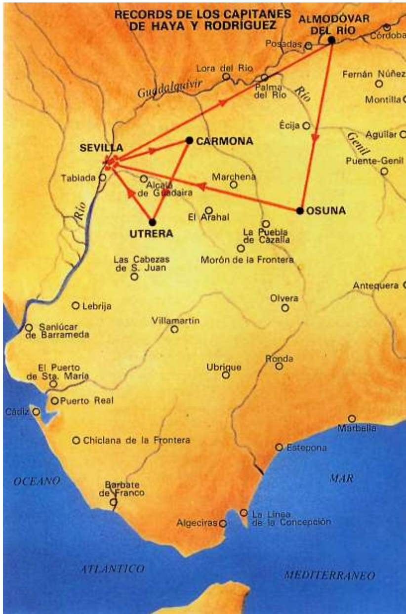
Ilustración 5. Mapa con el Récord de los capitanes De Haya y Rodríguez

porque, para una determinada distancia, el número de vueltas era menor. Otro circuito corto, de 105 km., con vértices en Sevilla, Carmona y Utrera, más apto para el vuelo nocturno, ya que al tener los tramos más cortos, permitía mantenerse en circuito con mayor facilidad durante la noche o en el caso de que se presentasen nieblas; asimismo, los puntos elegidos eran fácilmente identificables por la noche debido a la iluminación de las poblaciones designadas.