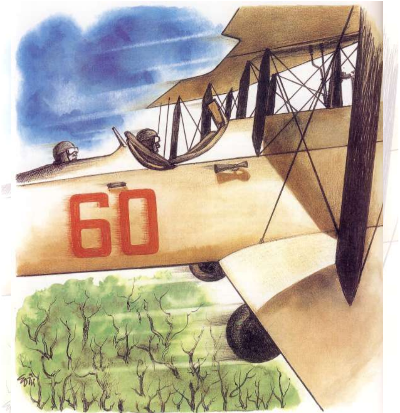
Ilustración 1. Portada con la vista lateral del avión Breguet XIX –Superbidón– iniciando el vuelo